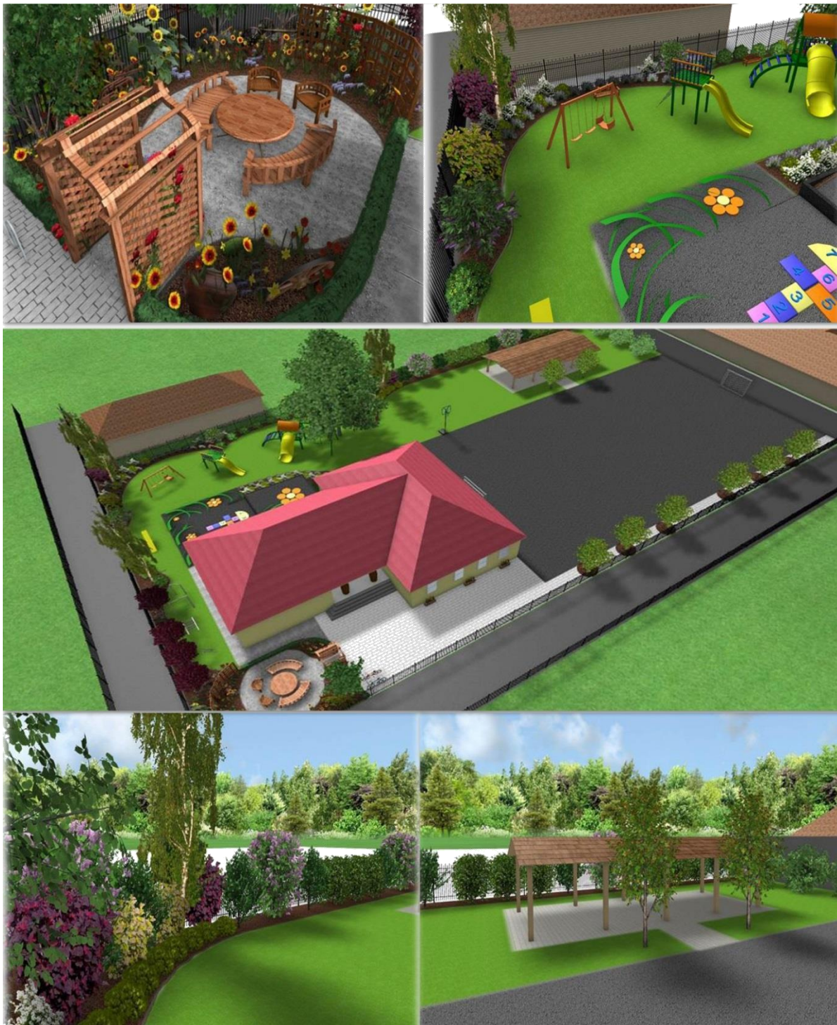
Ryc. 3 Koncepcja terenu wspólnego przy świetlicy we wsi Górki mająca na celu podniesienie bioróżnorodności (autor: D. Pach, J. Szmechta, opieka merytoryczna A. Podolska)