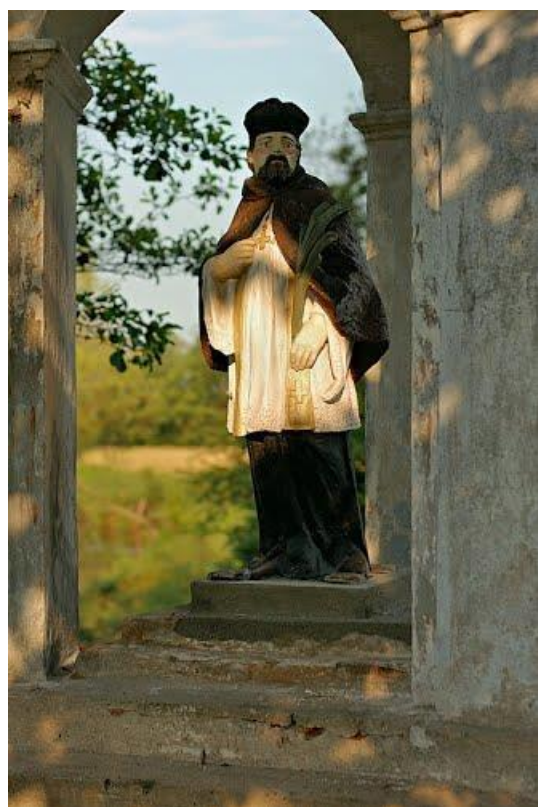
Figury czeskiego świętego Jana Nepomucena są często spotykane w polskim krajobrazie. Stawiano je nieopodal rzek i strumieni, aby chronił okolice przed powodzią.

Mimo rywalizacji na niwie politycznej pomiędzy Polakami i Czechami, którzy walczyli o prymat w państwie Franciszka Józefa i uzyskanie podobnej Węgrom autonomii, na polu kultury obecne były liczne wzajemne zapatrzenia i wspólne obu nacji zjawiska należące do nurtu sztuki środkowoeuropejskiej. Należy tu recepcja dzieła polskiego noblisty Henryka