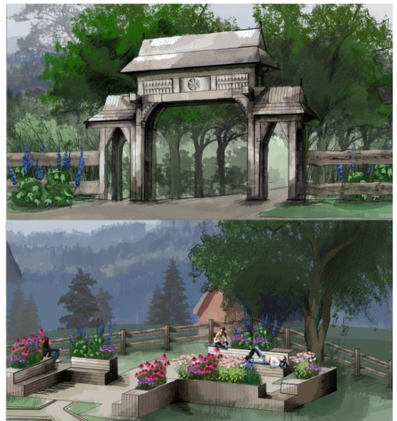
Ryc. 1. Koncepcja zagospodarowania przestrzeni publicznej we wsi Glinka, w której mała architektura nawiązuje stylowo do architektury regionalnej (aut. E. Trawińska, promotor A. Podolska)