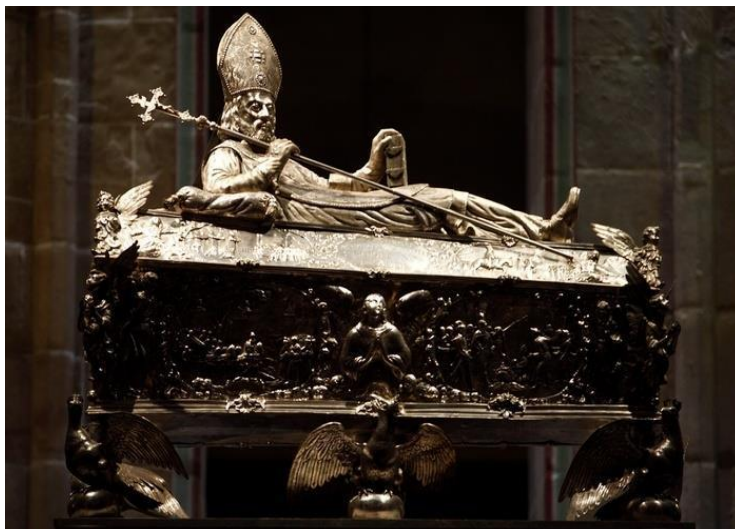
Postać świętego Wojciecha ze srebrnej trumny-relikwiarza w gnieźnieńskiej katedrze wykonana w XVII wieku przez Piotra van der Rennena.

awangardowej wówczas sztuki secesyjnej. Stylistyka ta objęta swym wpływem najważniejsze ośrodki sztuki europejskiej, w tym Kraków i Lwów.