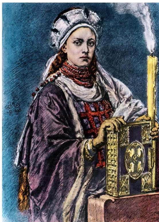
Dobrava z rodu Przemysłidów wyobrażona przez Jana Matejkę. Nazywana jest Matką Chrestną Polaków.

Okres wojny trzydziestoletniej stał się przełomowym czasem, kiedy utracona niepodległość i intensywna germanizacja doprowadzały do wynarodowienia i utraty kulturowej tożsamości Czechów. Zaciekła walka z czeskiimi innowiercami prowadzona przez Habsburgów znalazła swój finał w wygranej przez nich bitwie pod Białą Górą w 1620 roku. Najbardziej postępowi Czesi zostali wyeliminowani poprzez egzekucje, rekwizycje majątków lub przymusową emigrację. Wielotysięczna rzesza osób opuściła czeskie ziemie udając się m.in. na teren Królestwa Polskiego, gdzie w 1628 roku w Lesznie powstała ponad tysięczna kolonia czeska złożona z uchodźców z Czech i Moraw. W grupie tej ważną rolę odgrywał słynny pedagog i kalwinista Jan Amos Komensky , który zanim ostatecznie osiadł w Amsterdamie, był jedną z najważniejszych postaci na protestanckim dworze Rafała Leszczyńskiego.