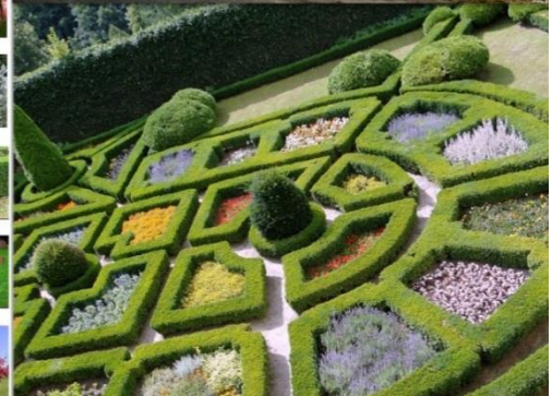
Ryc. 2. Koncepcja zagospodarowania dawnego fragmentu założenia folwarcznego przy parku podworskim (autor: M. Bienek, A. Cisowska, opieka merytoryczna A. Podolska)