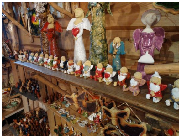
Dobkov – wizyta studyjna – wystawa

Kilkudniowa wizyta studyjna kusila atrakcjami i ciekawostkami. Rozpoczęła się prezentacją dotyczącą ceramiki w Dobkowie, będącej przykładem dobrej praktyki wspólnego działania, wpisującej się w specyfikę miejscowości. Ważne jest, by bazować na lokalnych zasobach, gdzie obok Dobkowskiej ceramiki kolejnym świetnym przykładem jest mydlarstwo (miejscowe zioła). Tak właśnie buduje się ofertę wsi i poprawia warunki życia w niej i stąd pomysł na utworzenie Centrum Nauki, czyli Sudeckiej Zagrody Edukacyjnej. To właśnie tutaj padły